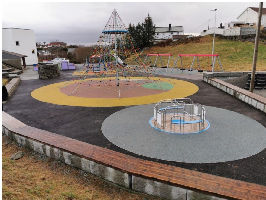
Bilde 4: Den nye skolegården på Kopervik skole

barneskole, Kopervik barneskole og Bygnes vitenbarnehage er oppgradert og har fått lekeapparater som er universelt utformet.