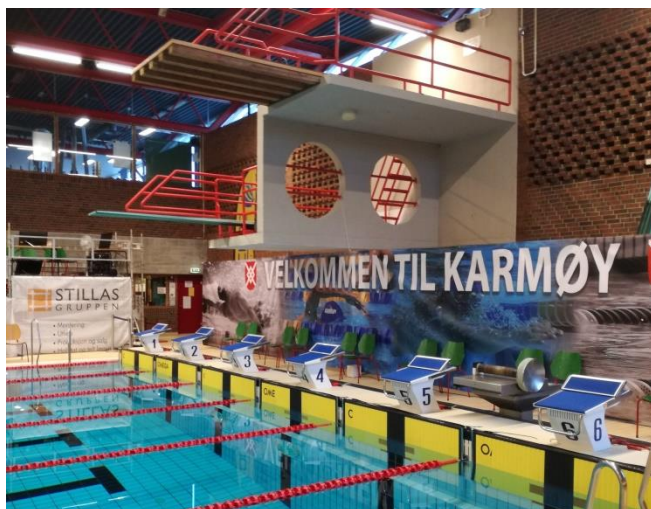
Bilde 2: Fra Karmøyhallen basseng

Barn og ungdom driver utstrakt uorganisert fysisk aktivitet både i barnehagene, skolene, i nærmiljøene, på idrettsanleggene og i forbindelse med friluftsliv.