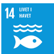
LIVET I HAVET