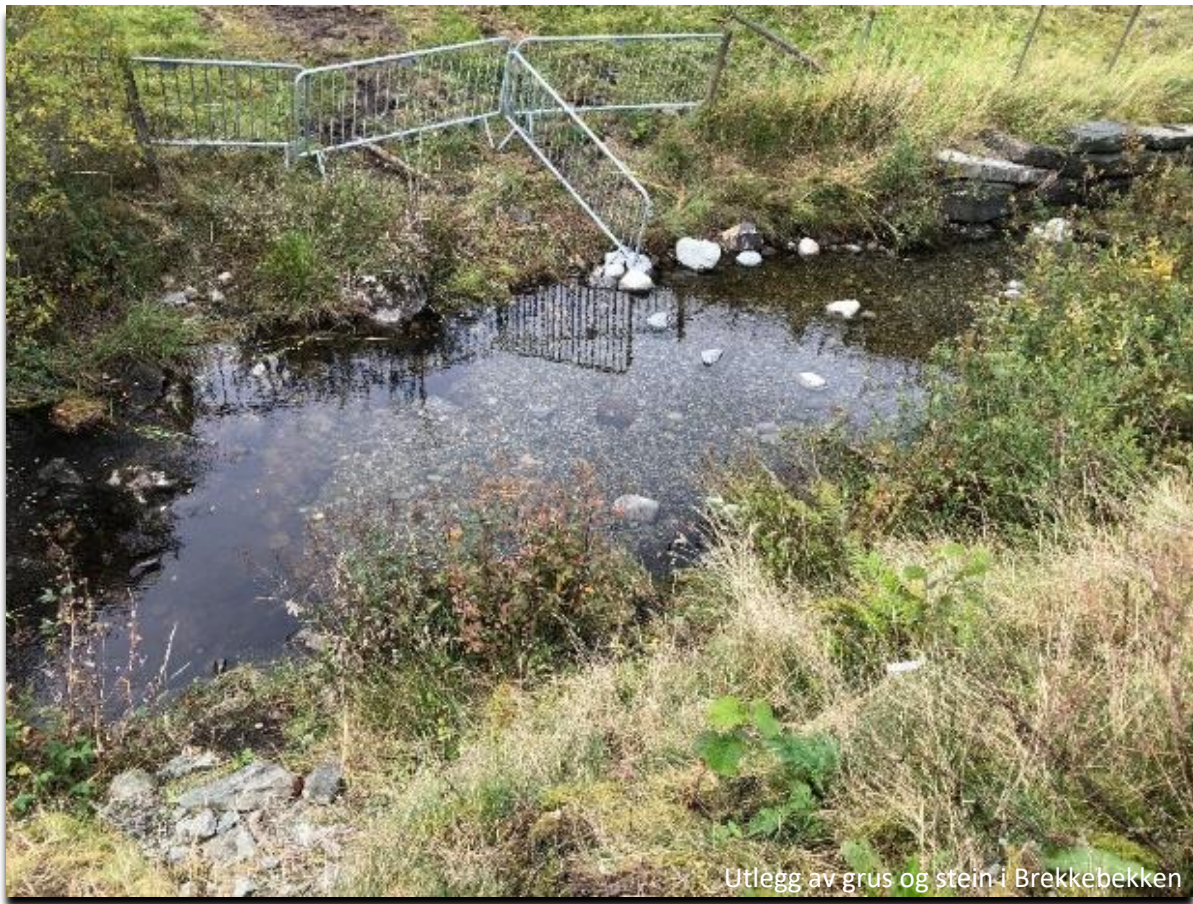
Utlegg av grus og stein i Brekkebekken