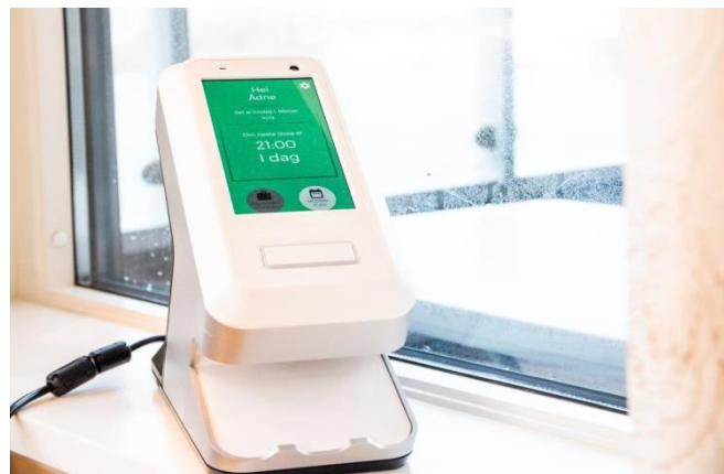
Bilde viser en medisindispenser

For å klare dette kan det være nødvendig at den enkelte gjør tilpasninger i boligen og/eller tar i bruk hjelpemidler og teknologiske løsninger. Les mer om hjelpemidler og teknologiske løsninger..