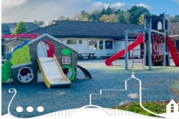
Vormedal barnehage (avd. nord)