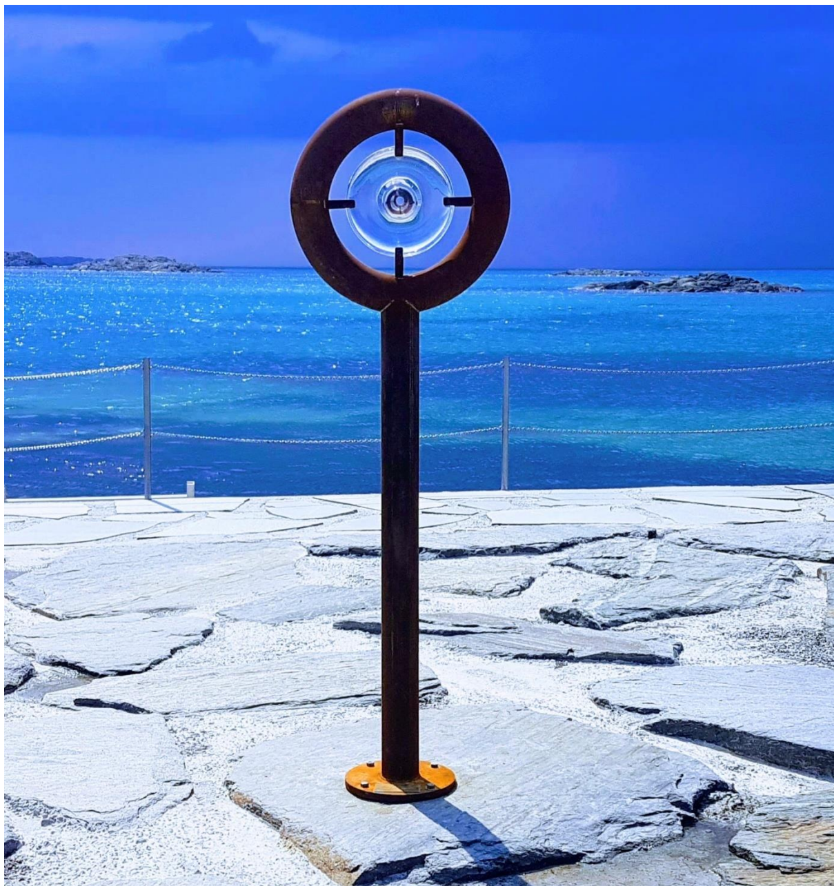
Skulpturen Tid av Kirsten Vikingstad Storesund.