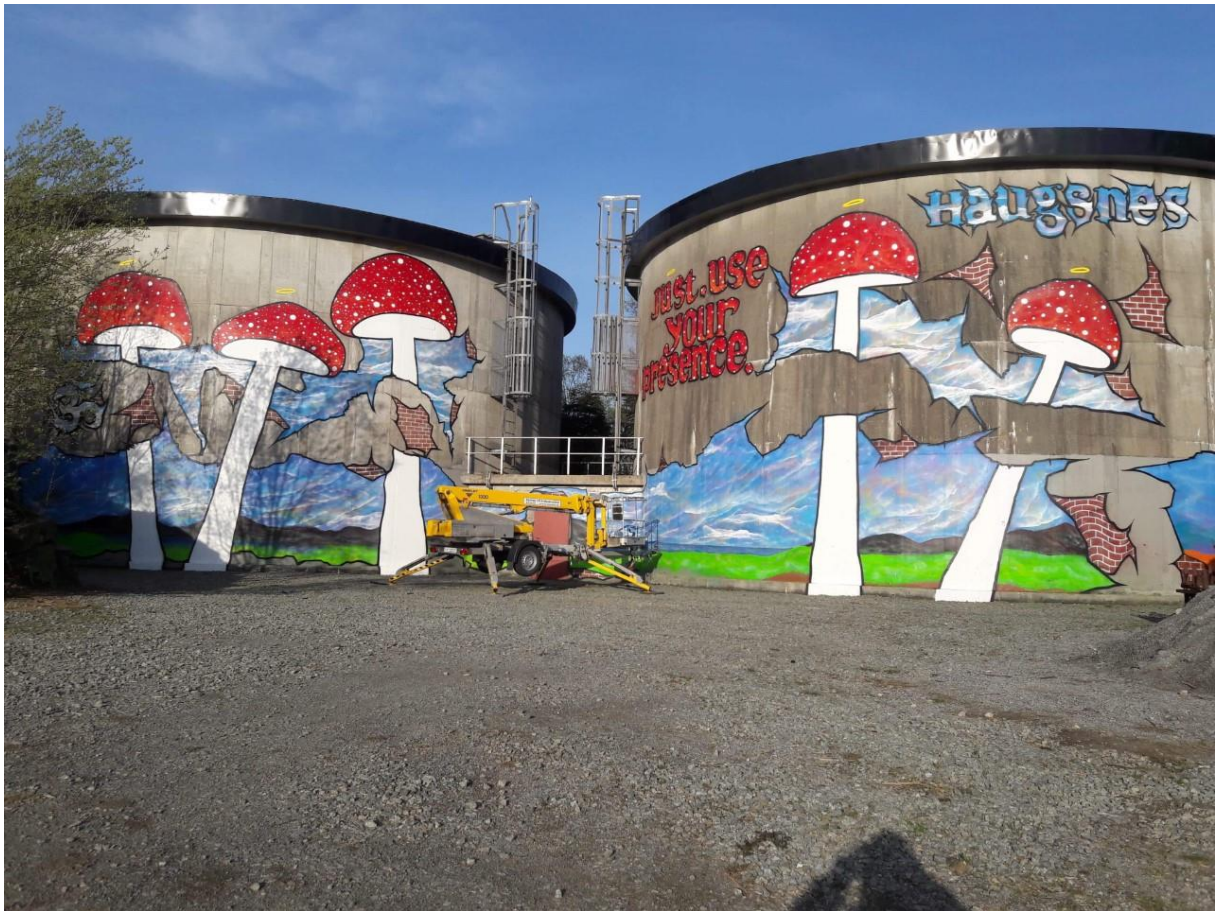
Street art på Spanne, eit prosjekt i regi av DKS Karmøy og street artist Bjørn Olaf Gudmestad Haugsnes, 2019